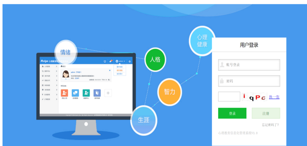
图 2 心理测验电脑平台