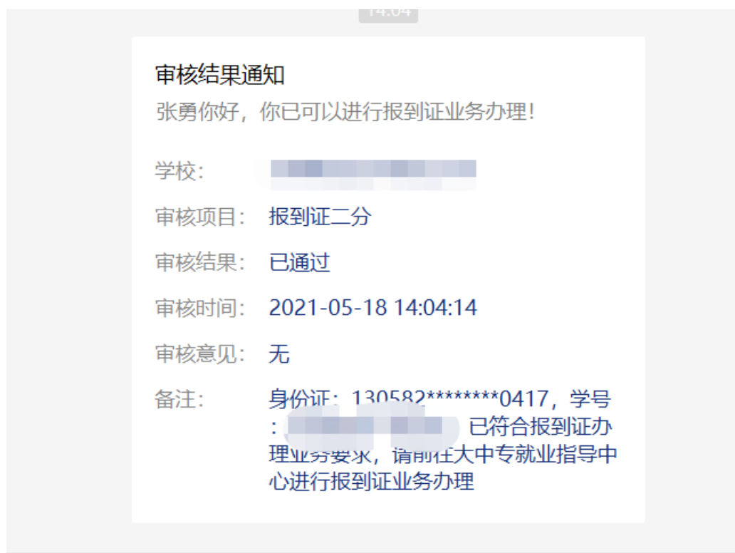
图 6 学生收到的反馈信息