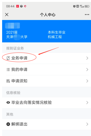
图 4 学生端发起图例

学生在提交时务必勾选正确的“办理业务类型”、上传派遣事项对应的相关材料。上报成功后，等待学校审核（图 5 以改派报到证页面为例）。