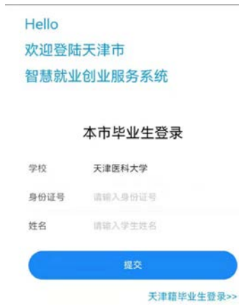
图 3 学生登录图例