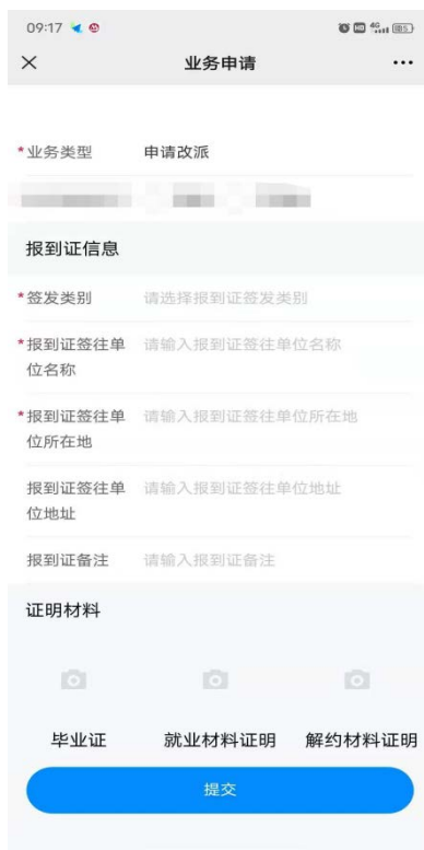
图 5 学生端改派填写图例

学生在提交时务必勾选正确的“办理业务类型”、上传派遣事项对应的相关材料。上报成功后，等待学校审核（图 5 以改派报到证页面为例）。